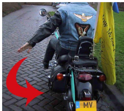
Naar rechterbaan schuiven

Wij wensen iedereen fijne en veilige motorritten toe in 2012!