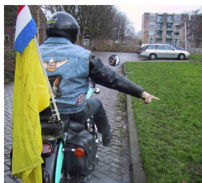
Let op! Obstakel Rechts