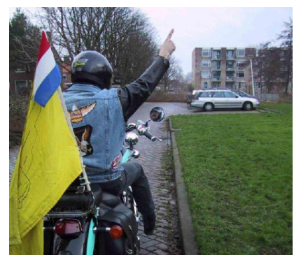
Let op! Snelheidscamera