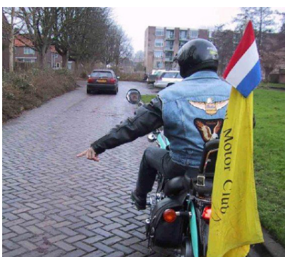
Let op! Obstakel Links